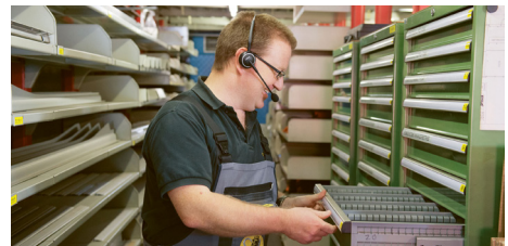
6'000 Original-Ersatzteile auf Abruf bereit