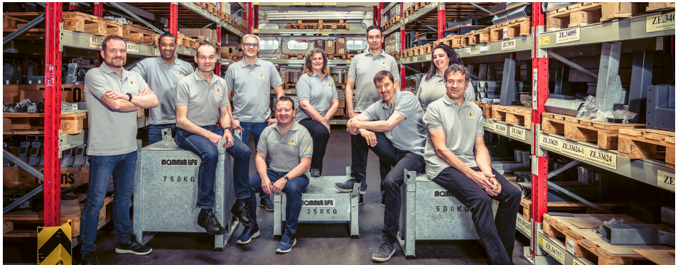
Auf diese Kräfte ist Verlass

Am Rotbach 10 6033 Buchrain info@mammut-lift.ch www.mammut-lift.ch